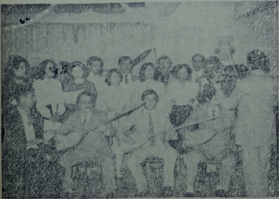
Atatürk'ün yeni nesli emanet ettiği öğretmenler geçen seneki eğlentilerinde görülüyor.

Aynı günün akşamı saat 19.30 da Azot Sanayii sosyal tesislerinde düzenlenen öğretmenler yemeğinin geçen senekine nazaran daha güzel geçeceği söylenmektedir.