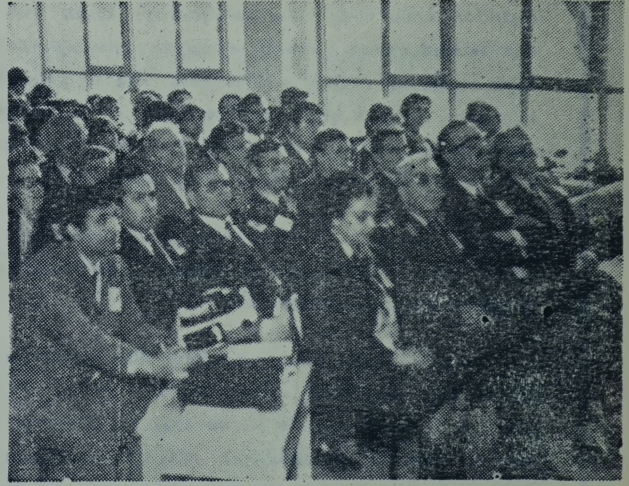
Resimde: Anma törenine katılanlardan bir grup.

İlçe okullarında da Dünya Çocuk Kitapları Haftasının başlaması nedeniyle konuşmalar yapılmış ve şiirler okunmuştur.